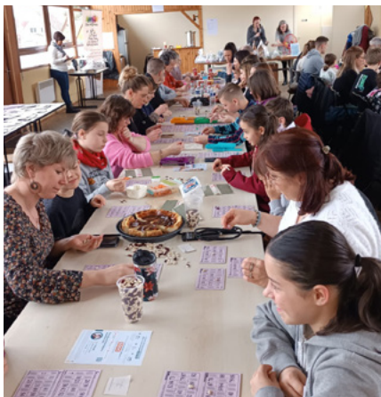
Encore un très gros succès pour le 2 e lotto de l'Association jeux m'amuse !