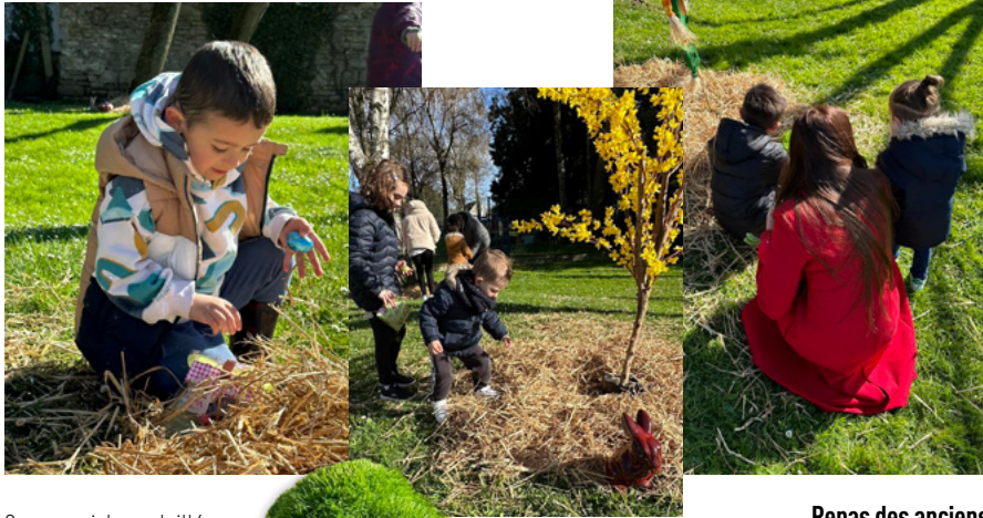
Sous un ciel ensoleillé, la chasse aux œufs a rassemblé les petits et grands gourmands.