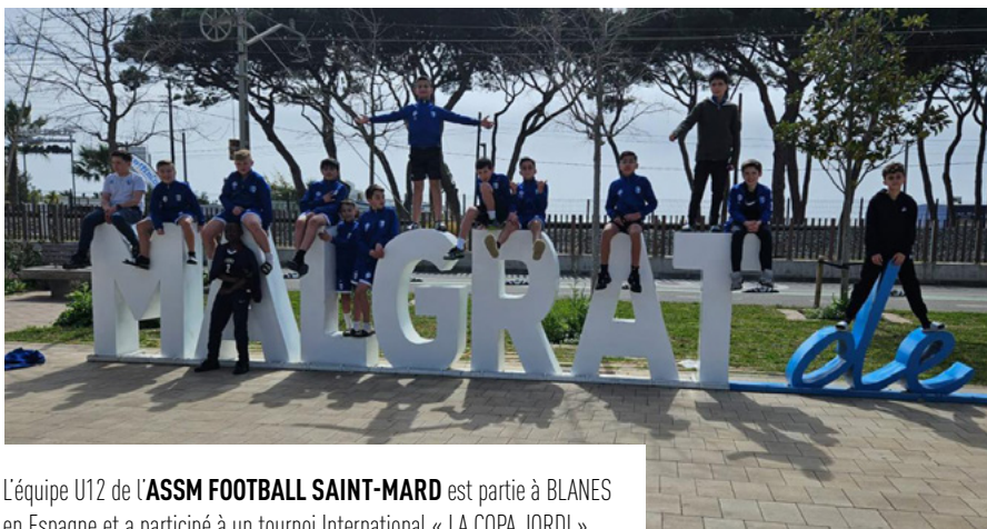
L'équipe U12 de l' ASSM FOOTBALL SAINT-MARD est partie à BLANES en Espagne et a participé à un tournoi International « LA COPA JORDI ».